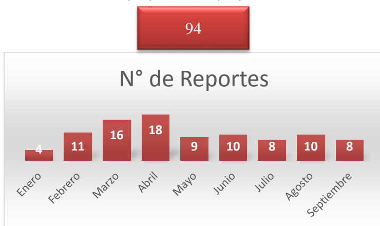
Gráfico 1. Reporte reacciones adversas a medicamentos de enero a septiembre de 2018

Cantidad de Reportes: 01/01/2018 a 30/09/2018